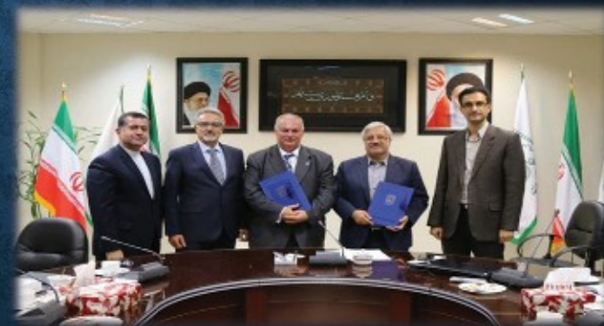
امضای تفاهم نامه همکاری با دانشگاه پلی تکنیک لیریا- پرتغال