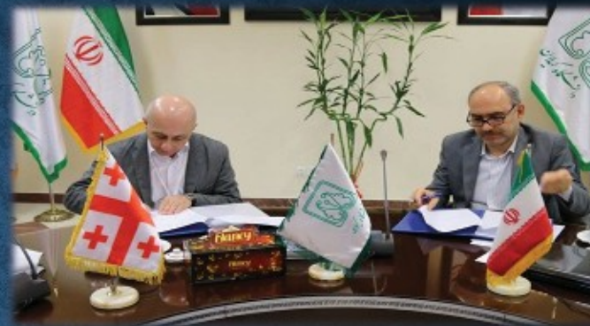
امضای تفاهم نامه همکاری با دانشگاه هنر باتومی گرجستان - ۱۳۹۵