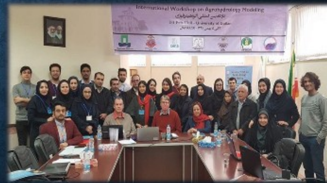
برگزاری کارگاه بین المللی اکروهیدرولوژی