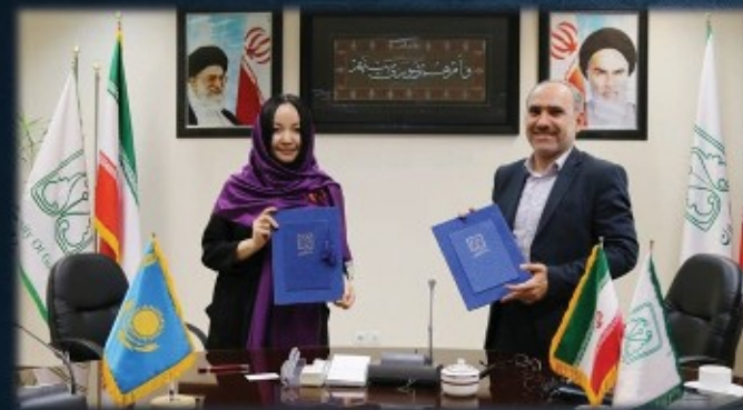
امضای تفاهم نامه همکاری با دانشگاه دولتی آذربایجان - ۱۳۹۶