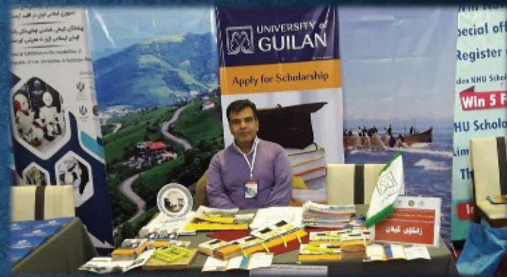
حضور در اولین نمایشگاه توانمندی دانشگاه های ایران در زمینه تحصیلات عالی - اربیل