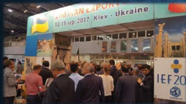
شرکت در دومین نمایشگاه توانمندی های صادراتی ایران در اوکراین