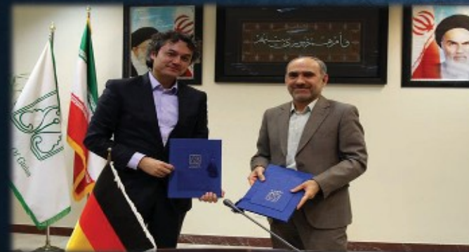
امضای تفاهم نامه همکاری با دانشگاه هیلدسهایم آلمان