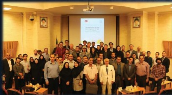
چهارمین سمپوزیوم GECI (مرکز انرژی سبز ایران) با همکاری دانشگاه تی یو برلین آلمان