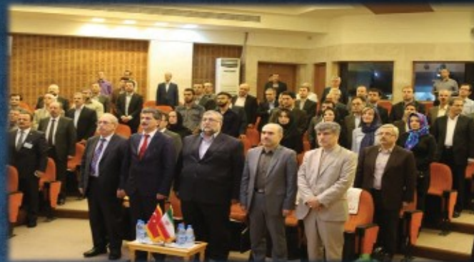
برگزاری نهمین همایش روابط فرهنگی و تاریخی ایران و ترکیه