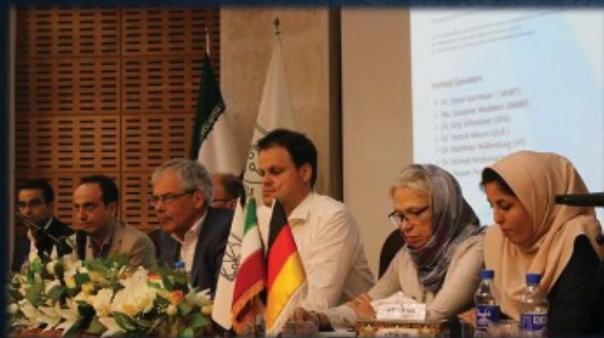
میزبانی نمایندگان موسسات حمایتی کشور آلمان